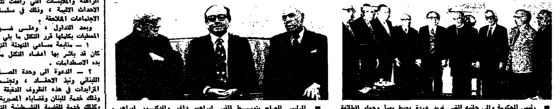
الرئيس الصالح يستكمل جولته على رؤساء الطوائف الروحية